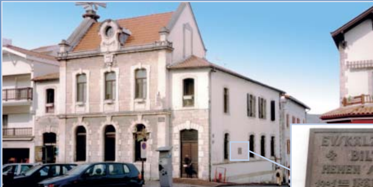
1901. urtean Endaian sortutako Euskalzaleen Biltzarra-ren plaka oroigarria Placa conmemorativa de la creación en 1901 en Hendaia de "Euskalzaleen Biltzarra"